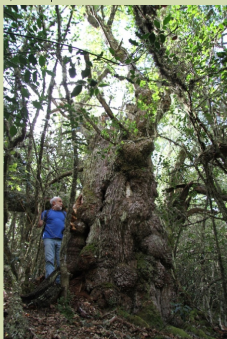
-7,50 m de perímetro.