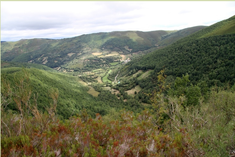
Vista sobre o val de Suárbol