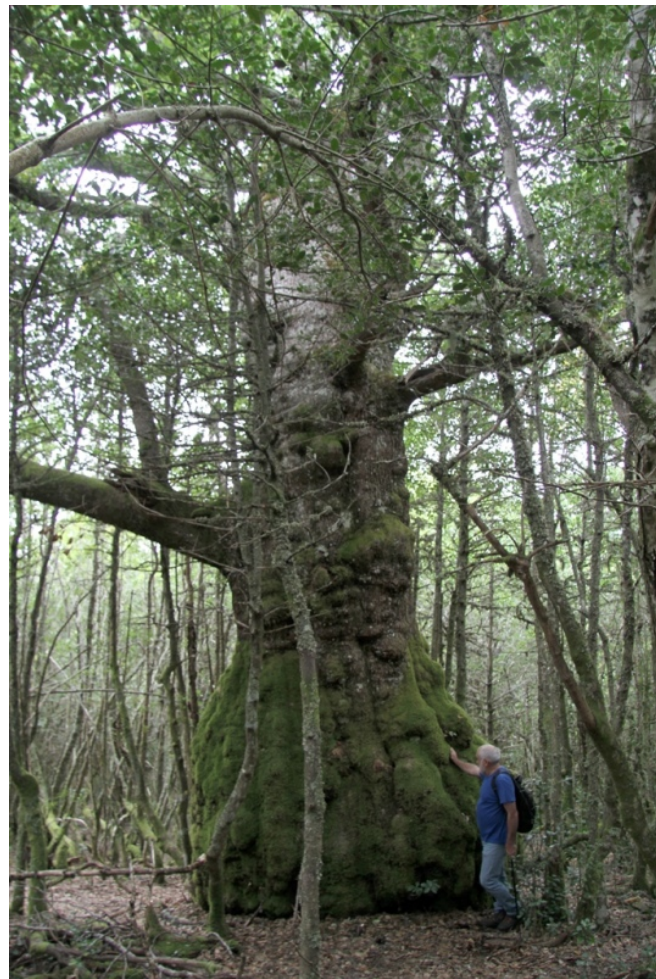
Carba de 10,30 m de perímetro