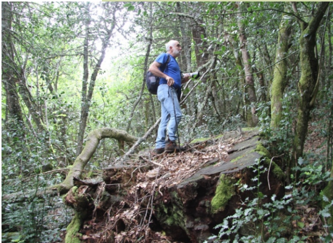
.No monte aínda se ven as cepas dalgúns exemplares talados non se sabe cando.