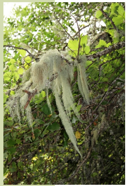
Liques (barbas de frade)