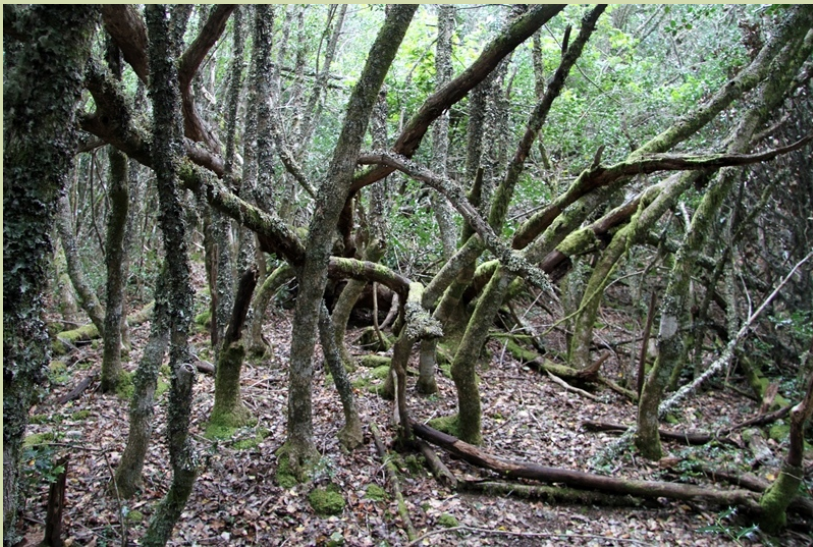
Toros de acivros

Aínda que coñecer este bosque ben paga unha visita aos Ancares, Piornedo, como todo o espazo, ofrece ademais múltiples opcións xeográficas, paisaxísticas, etnográficas... que podemos aproveitar e gozar en calquera época do ano para facer a viaxe máis completa.