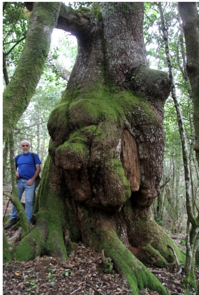
Carba de 8,50 m de perímetro