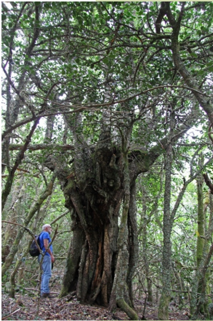
- 4,30 m de perímetro.