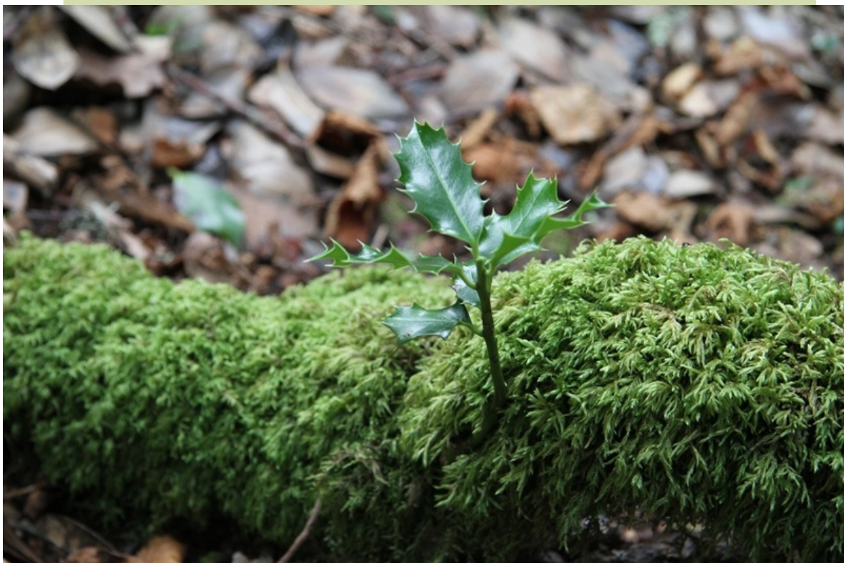
Acivro nacido nun toro morto.