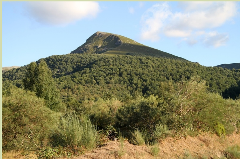
Vista xeral do bosque dos Acebais e Penalonga