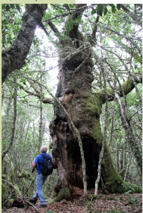
-8,50 m de perímetro

Achegarse a un destes "venerables anciáns" infunde respeto e produce un placer especial, semella que a árbore nos transmite a súa enerxía, as súas vivencias e a súa paz.