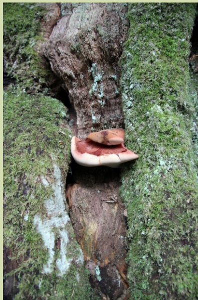
Fungo sobre o toro dunha árbore