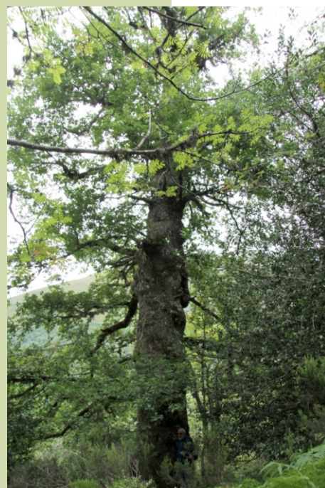
-5,50 m de perímetro.