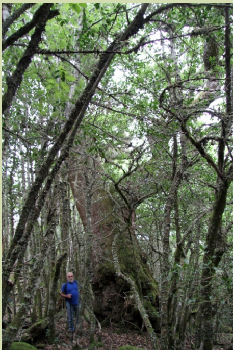
-8,10 m de perímetro.